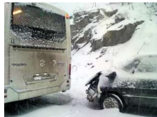
Avisa Nordlys, 8.11.2010 Ulykke pga en trailer sperrer veien