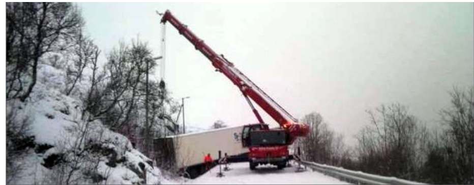
KRAN-HJELP: Denne traileren sto fast en hel dag i en bakke opp fra Ersfjordbotn, og måtte ha hjelp av kranbil for å komme seg løs igjen.