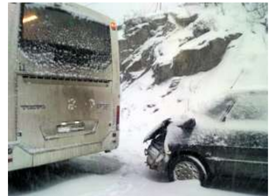
Ulykke pga en trailer sperrer veien